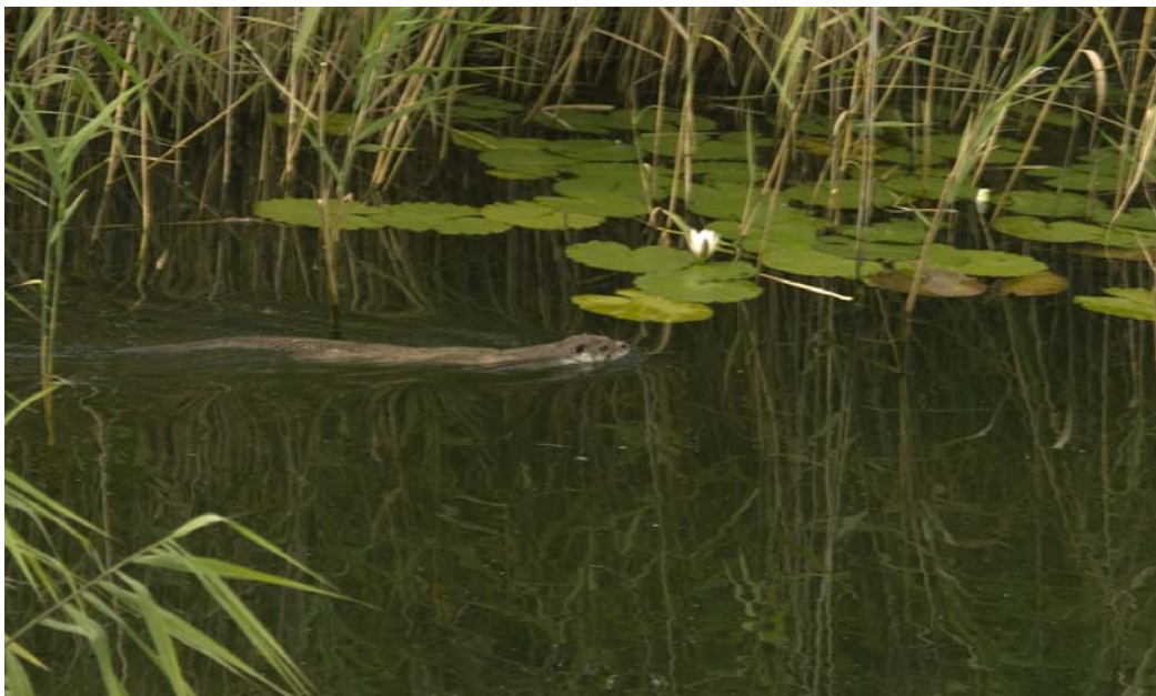
Zwemmende otter in typisch Nederlands habitat.

Realisatie van de geplande robuuste verbinding tussen de moerasgebieden in de kop van Overijssel met de potentiële leefgebieden in Zuid-Holland, die het mogelijk maakt dat otters betrekkelijk veilig kunnen migreren, is daarom zeer wenselijk.